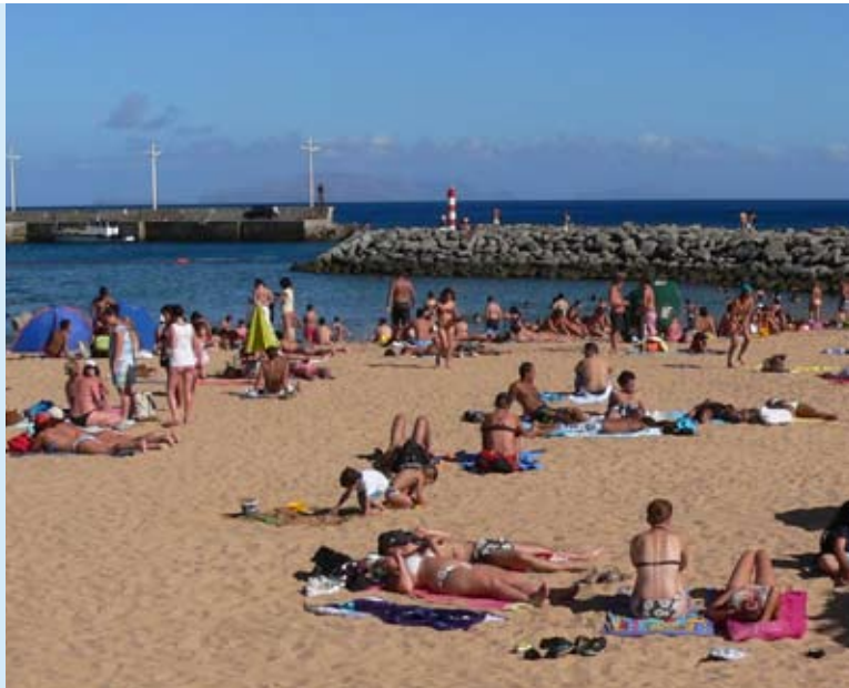
Abbildung 1: Übermäßiges Sonnenbaden fördert das Auftreten von hellem Hautkrebs. Weitere bedeutsame Risikofaktoren sind die Nutzung von Solarien sowie die regelmäßige Ausübung von beruflichen Tätigkeiten unter starker Sonneneinstrahlung.

Doch leider hat die Sonne auch Ihre Schattenseiten: Die schädlichen Folgen von zu intensiver Sonneneinstrahlung kennt jeder, der schon einmal einen Sonnenbrand hatte. Zwar sind die akuten Folgen dieser Entzündung