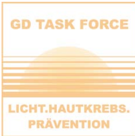
Abbildung 10: Mit dem Ziel, die hellen Hautkrebsformen stärker in das öffentliche Bewusstsein zu rücken, hat die Gesellschaft für Dermopharmazie im Februar 2003 die Task Force „Licht.Hautkrebs.Prävention“ eingerichtet, der Experten aus verschiedenen Fachgebieten angehören. Von dieser wissenschaftlichen Arbeitsgruppe wurde der Begriff „Heller Hautkrebs“ geprägt und verbreitet.

Einen relativ sicheren Schutz vor der Sonne bieten geeignete Textilien. Doch nicht jedes Kleidungsstück schützt gleich gut. Durch helle T-Shirts aus Baumwolle etwa gelangen noch bis zu 20 Prozent der UV-Strahlung auf die Haut. Ein durchnässtes T-Shirt kann sogar bis zu 50 Prozent der UV-Strahlung durchlassen. Selbst spezielle UV-Schutzkleidung gewährleistet keinen hundertprozentigen Schutz. Daher sollte in jedem Fall auch