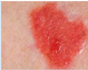
Abbildung 7: Der Morbus Bowen gilt ebenfalls als eine frühe Form des hellen Hautkrebses. Bei nicht rechtzeitiger Behandlung kann sich daraus ein Bowen-Karzinom entwickeln.

Der Morbus Bowen gilt als eine frühe Form des hellen Hautkrebses. Er zeigt sich in Gestalt einer flachen, scharf begrenzten, aber unregelmäßig geformten, rötlich-schorfigen Erhebung, die nässen und verkrusten kann (Abbildung 7). Die Erkrankung tritt vor allem am Unterschenkel, am Rumpf, im Gesicht oder an den Fingern auf und auch an Hautstellen, die kaum dem Sonnenlicht ausgesetzt sind. Wird der Morbus Bowen nicht rechtzeitig behandelt, kann er als Bowen-Karzinom in tiefere Gewebeschichten vordringen und sich weiter ausbreiten.