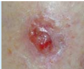
Abbildung 4: Das Basalzellkarzinom (Basaliom) ist die am weitesten verbreitete Form von Hautkrebs und die häufigste Krebsart des Menschen überhaupt.

Es gibt verschiedene Typen des Basalzellkarzinoms – knotige, flache, geschwürartige oder narbenförmige, die einzeln vor allem im Gesicht