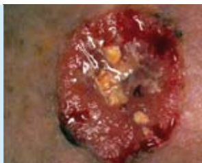
Abbildung 5: Das Plattenepithelkarzinom (Stachelzellkrebs oder Spinaliom) ist die zweithäufigste Form von Hautkrebs. Sie kann mit Metastasenbildung einhergehen und schlimmstenfalls einen tödlichen Verlauf nehmen.

Meist tritt es erst ab dem 60. Lebensjahr auf, wobei Männer häufiger betroffen sind als Frauen. In einem von sieben Fällen entwickelt sich der Tumor aus einer aktinischen Keratose, die nicht oder nicht ausreichend behandelt wurde. Beschwerden wie Juckreiz, Brennen, Spontanblutung