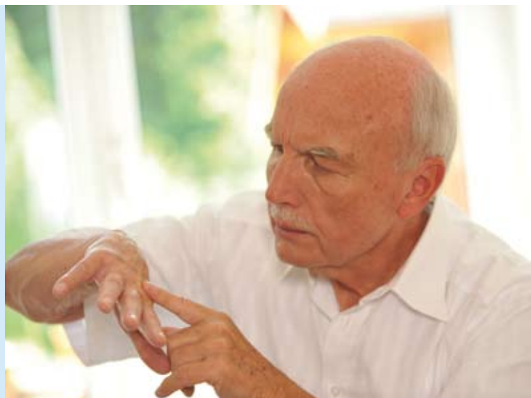
Abbildung 8: Da rechtzeitig erkannter heller Hautkrebs sehr gut heilbar ist, spielt die Prävention eine überragende Rolle. Zur Früherkennung sollte jeder seine Haut regelmäßig auf sonnenbedingte Auffälligkeiten prüfen. Werden dabei Hautstellen entdeckt, die wachsen, nässen, bluten, jucken, asymmetrisch erscheinen oder sehr dunkel sind, sollte zur Abklärung ein Hautarzt aufgesucht werden.

Die Aussichten auf eine dauerhafte Heilung sind für das Plattenepithel- und das Basalzellkarzinom sehr positiv: Bei dem letztgenannten betragen die Heilungschancen 95 bis 100 Prozent. Bei einem Plattenepithelkarzinom, das noch keine Metastasen gebildet hat, liegen sie zwischen 90 und 95 Prozent. Nach erfolgreicher Behandlung ist eine regelmäßige Kontrolle unerlässlich. Ganz wichtig ist auch die Aufmerksamkeit jedes Einzelnen für den eigenen Körper und etwaige Veränderungen. Jeder sollte seine Haut selbst regelmäßig auf Auffälligkeiten prüfen (Abbildung 8).