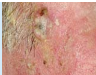
Abbildung 6: Die aktinische Keratose ist eine Frühform des hellen Hautkrebses, die meist in Gruppen oder großflächig verteilt auftritt. Unbehandelt kann daraus ein Plattenepithelkarzinom entstehen.

Aktinische Keratosen (AK) entwickeln sich oft unbemerkt. Sie werden in drei verschiedene Stadien eingeteilt. Im Anfangsstadium (mildes Stadium, AK I) ist nur ein Drittel der Oberhaut, der Epidermis, betroffen, im zweiten Stadium (moderates Stadium, AK II) erstreckt sich die aktinische Keratose auf zwei Drittel der Epidermis, und im dritten Stadium (schweres Stadium, AK III) erfasst sie die gesamte Epidermis. Entsprechend ändert sich das Erscheinungsbild: Anfangs treten die aktinischen Keratosen als kleine gerötete oder rötlich braune Läsionen der Haut auf, bei denen die oberste Hautschicht ausdünn, so dass erweiterte Blutgefäße dort stärker hervortreten. Die Flecken werden später zu flachen rötlichen Knötchen, die graubraun verhornen, oder auch zu schuppigen und krustigen Erhebungen (Abbildung 6).