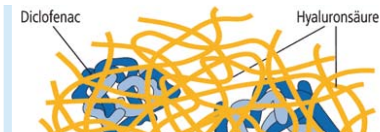
Abbildung 9: In einem Gel zur Behandlung von aktinischen Keratosen wird der Wirkstoff Diclofenac (blau) wolkknäuelartig in eine Faserstruktur aus Hyaluronsäure (gelb) eingelagert. Dadurch kann er in ausreichender Menge in die Oberhaut eindringen und lang genug dort verweilen.

Die Zubereitung ist meist gut verträglich und führt in 80 Prozent der Fälle zu einer kompletten Abheilung oder deutlichen Besserung. Das Gel wird zweimal täglich über einen Zeitraum von bis zu 90 Tagen angewandt und ist auch bei Organtransplantierten mit aktinischen Keratosen eine effiziente, sichere und einfache Therapie mit nur geringen Nebenwirkungen.